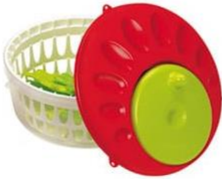
L'ESSOREUSE À SALADE