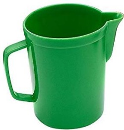
LE POT À EAU