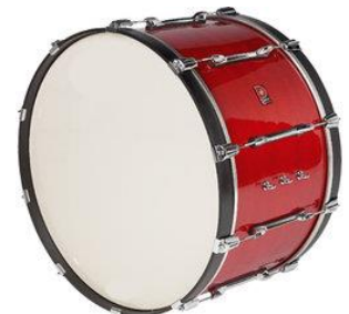
la grosse caisse