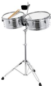
les caisses claires