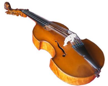
la viole de gambe