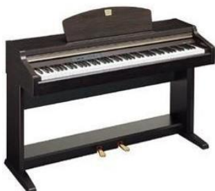
le piano électrique