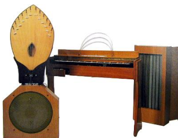
les ondes Martenot