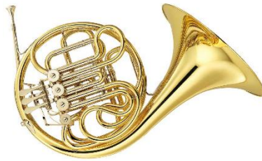
le cor d'harmonie