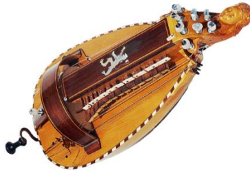
la vielle à roue