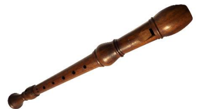
la flûte à bec