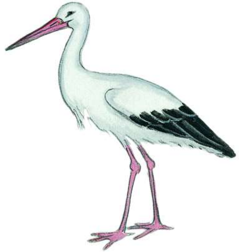
CIGOGNE cigogne cigogne