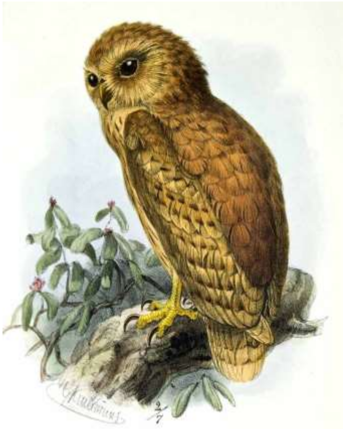
CHOUETTE chouette chouette