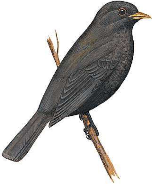
MERLE merle merle