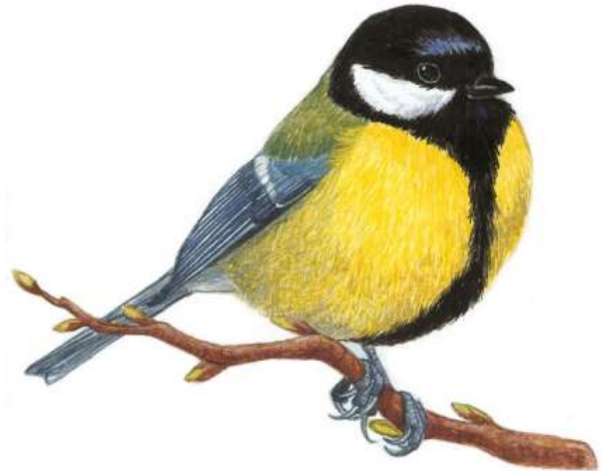
MESANGE mésange mésange