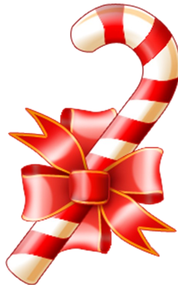
CANNE A SUCRE