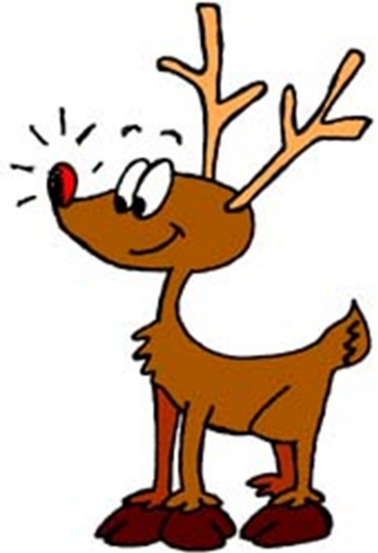
RUDOLPHE LE RENNE AU NEZ ROUGE