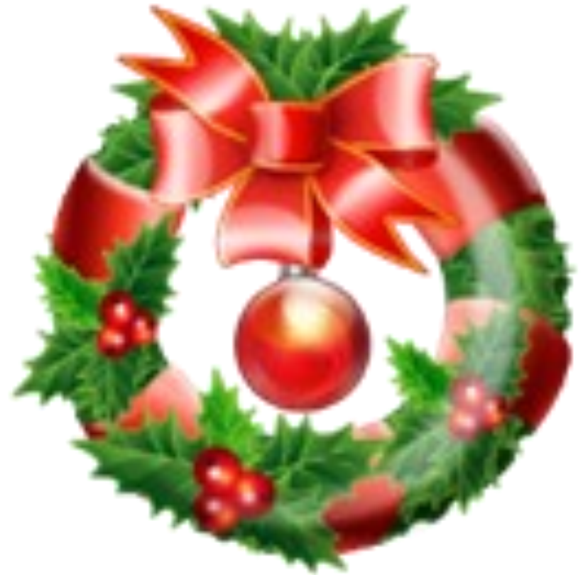
COURONNE DE NOEL