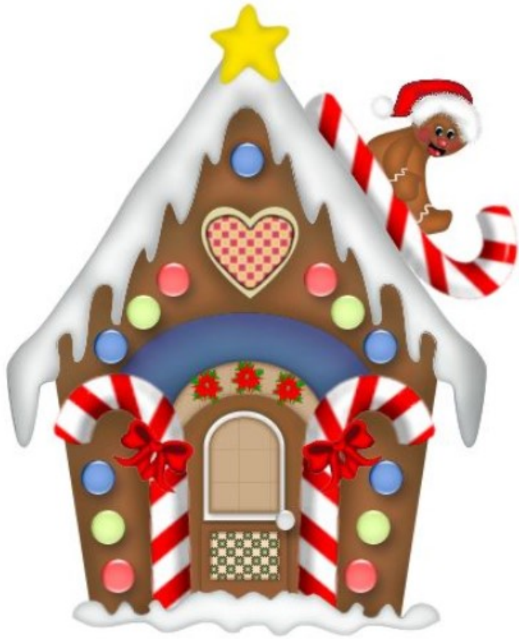
MAISON EN PAIN D'ÉPICES