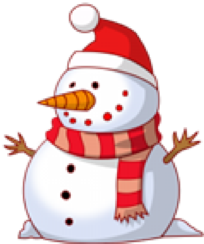
BONHOMME DE NEIGE