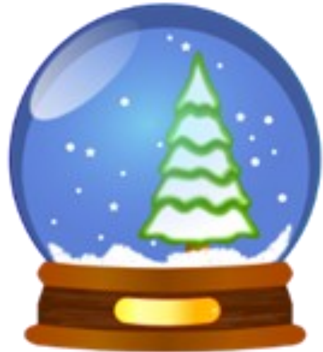
BOULE A NEIGE