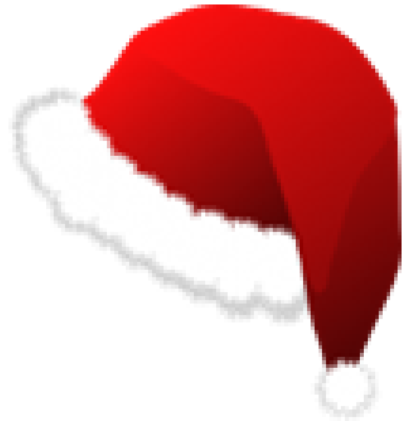
BONNET DU PÈRE NOEL