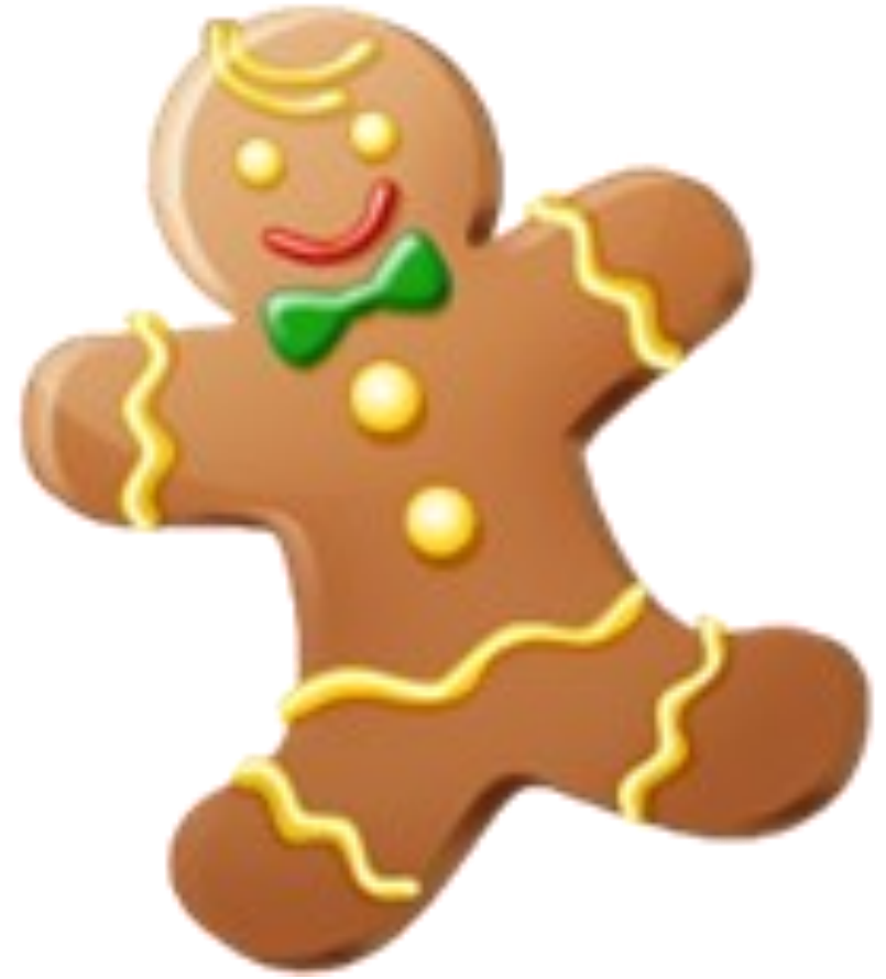
BONHOMME DE PAIN D'ÉPICES