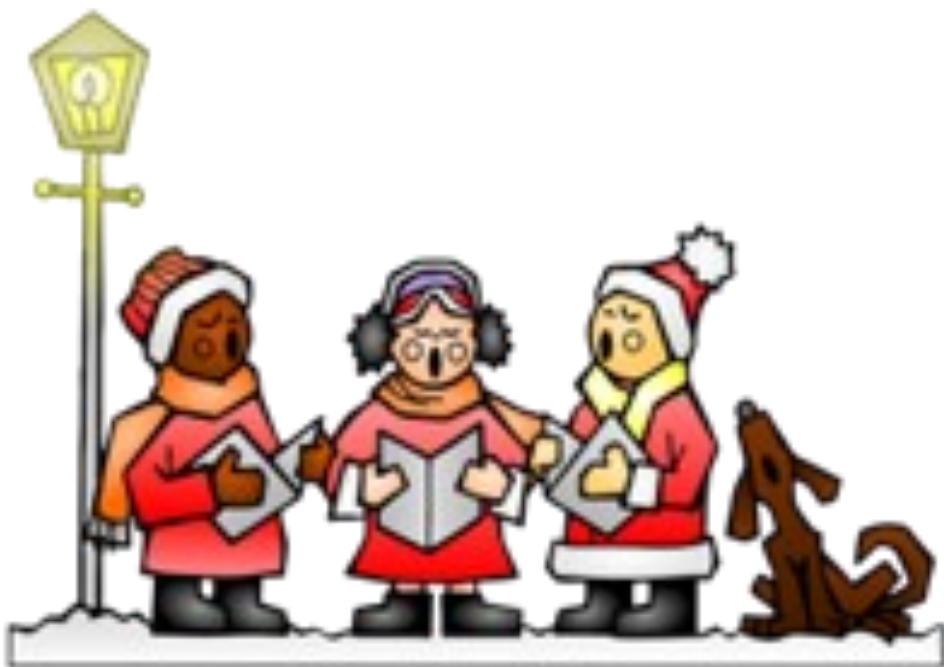
CHANTS DE NOEL