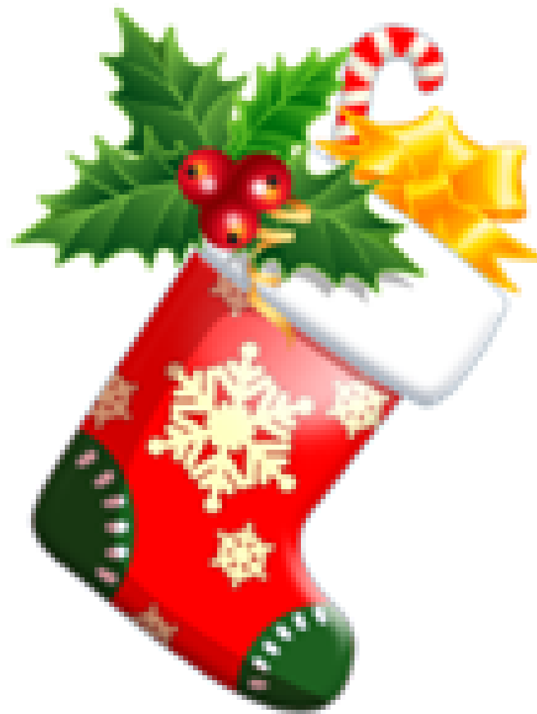
CHAUSSETTE DE NOEL