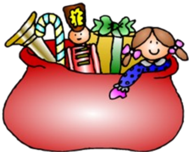
HOTTE DU PERE NOEL