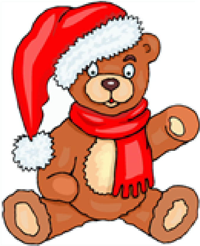
OURS EN PELUCHE