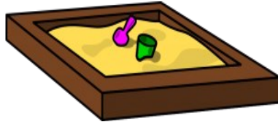
UN BAC A SABLE