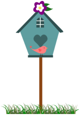
UNE CABANE A OISEAUX