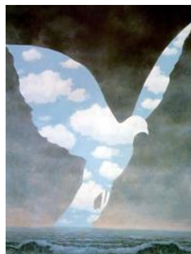
La grande famille, 1947