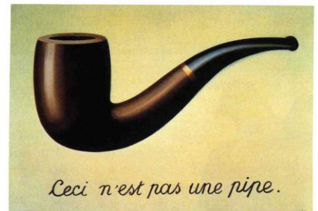
La trahison des images, 1928-29

activités. Les liens avec les surréalistes parisiens restent difficiles, et René Magritte se brouille avec André Breton. La crise de 1929 arrivant en Europe, René Magritte doit retourner en Belgique en 1930, les contrats de publicité qui lui permettaient de vivre ayant été rompus. Il adhère l'année suivante au Parti communiste belge. De 1943 à 1945, Magritte utilise la technique des impressionnistes durant sa période du surréalisme. Paraissent alors les premiers livres qui lui sont consacrés. Le succès de Magritte vient lentement, à partir de 1957. Il meurt chez lui à Bruxelles le 15 août 1967 d'un cancer à soixante-huit ans.