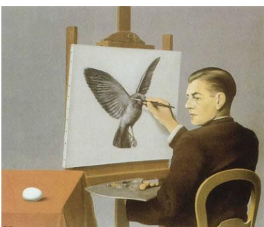
La Clairvoyance, 1936

Pour Magritte la peinture n'est jamais une représentation d'un objet réel, mais l'action de la pensée du peintre sur cet objet. Magritte excelle dans la représentation des images mentales.