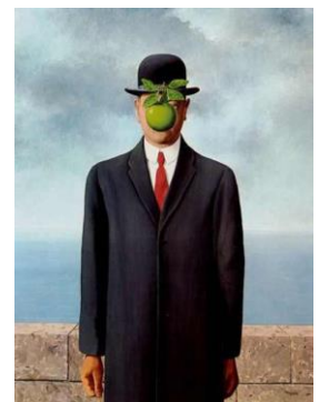
Le fils de l'homme, 1964